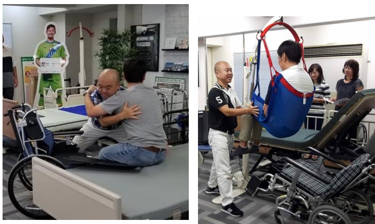
スライディングボードや介護用リフトを使った 介護ベッドから車椅子への移乗体験