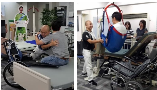
スライディングボード・電動リフトを使った、 介護ベッドから車椅子への移乗体験