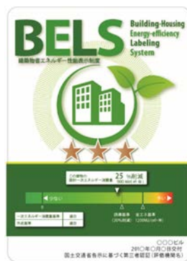
〔図1〕 ガイドラインに基づく第三者認証の例

また、ダイヤモンドリスponsに対応した時間帯別・季節別の電気料金メニューが選択できる場合はその活用に努めるとともに、エネルギー管理システム（BEMS・HEMS等）の導入により、ビルの運用方法、住宅の住まい方の改善によるピーク対策及び省エネルギーに努めること。