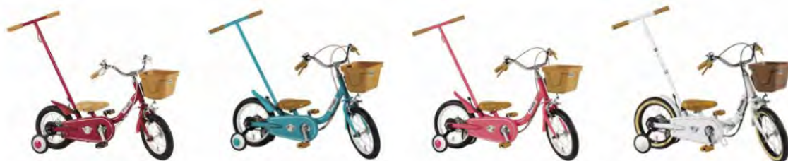
12 インチ スカーレット 14 インチ ブルーミングターコイズ / ブルーミングラズベリー 14 インチプレミアムホワイト