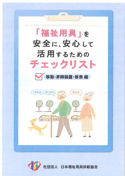
①「福祉用具」を安全に、安心して活用するためのチェックリスト (移動・昇降装置・移乗編)

社内研修のテキストに最適です。 福祉用具事業所、介護職員、施設職員、行政機関などで 研修や勉強会を行う際にぜひご活用ください。