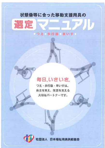
③状態像等に応じた移動支援用具の選定マニュアル (つえ・歩行器・車いす)

福祉用具の事故の要因となる注意すべき身体の動きの3点「崩れる(姿勢の不安定性)」「ぶつかる(する)」「はさむ」に着目して、個別の用具に合わせたチェックリストとなります。