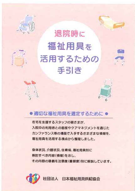
④退院時に福祉用具を活用するための手引き

利用者の状態像に応じた、移動支援用具の交換や追加のタイミングについて、わかりやすく纏めた小冊子となります。