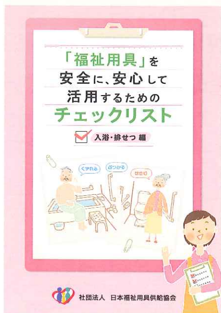
②「福祉用具」を安全に、安心して活用するためのチェックリスト (入浴・排せつ編)

福祉用具の事故の要因となる注意すべき身体の動きの3点「崩れる(姿勢の不安定性)」「ぶつかる(する)」「はさむ」に着目して、個別の用具に合わせたチェックリストとなります。