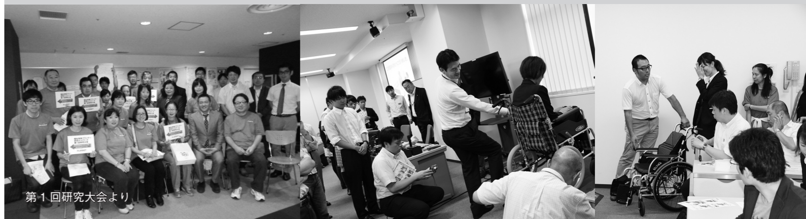
第1回研究大会より