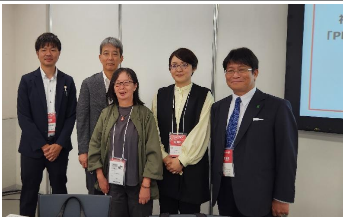
左写真 出演者の皆様