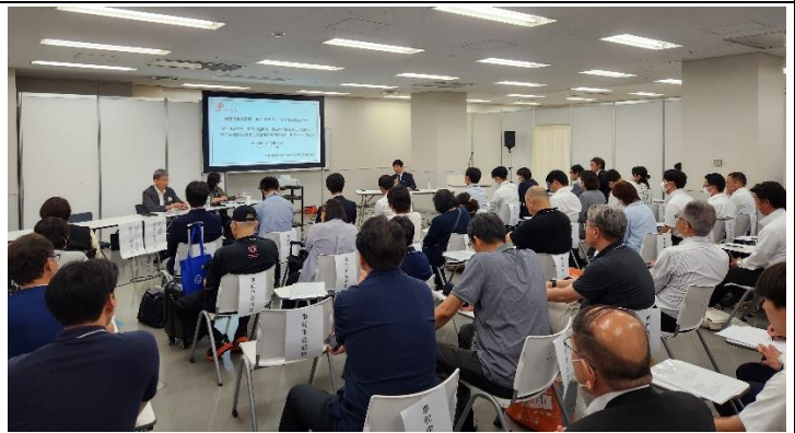
左上・右上写真共に、本会のプレゼンテーションの様様